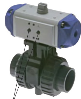
für Namuranschluss und IG

Achtung: Nicht für Druckluft oder andere Gase unter Druck geeignet!